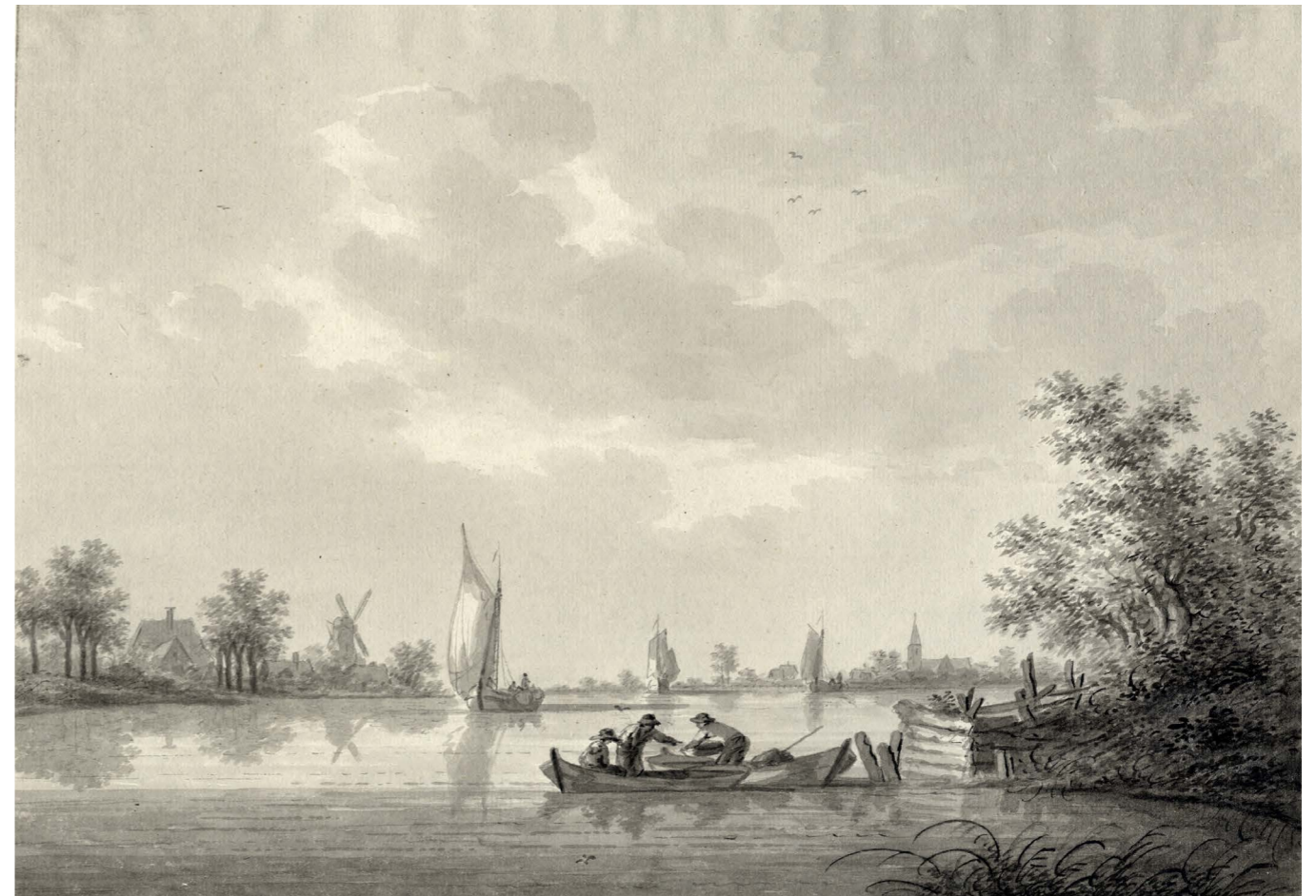
Gezicht over de Lek op het dorp Jaarsveld met op de achtergrond de achtkantige voormolens op de zomerdijk.

In 1599 werd een constructie aangelegd met 3 molens en een heul (duiker met keerklep) in de Lekdijk waardoor het water toch weer op de rivier kon worden geloosd. In de 16e eeuw was het land erg nat, waardoor eigenlijk alleen maar teelt van rijshout mogelijk was. Met de nieuwe opzet van de afwatering via de heul werd vanaf 1599 het land opnieuw bruikbaar voor veeteelt. Dit afwateringssysteem heeft dienstgedaan tot de aanleg van het stoomgemaal bij de heul aan de Lekdijk in 1872.