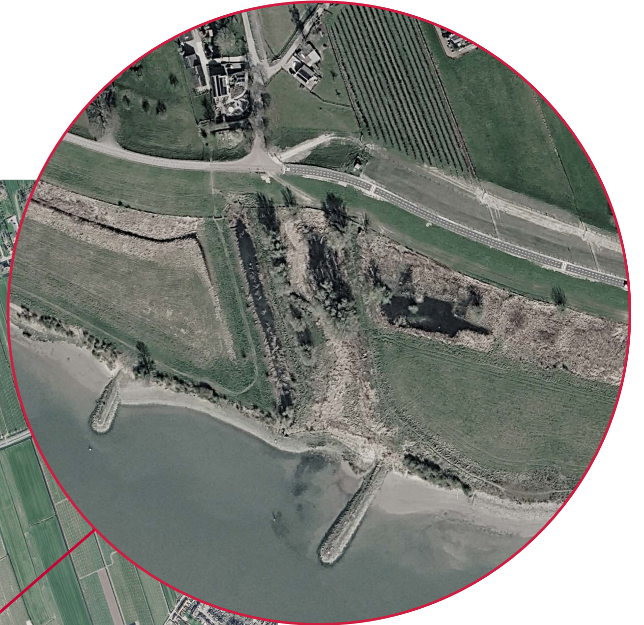
Locatie De Heul, Google Earth, 2026