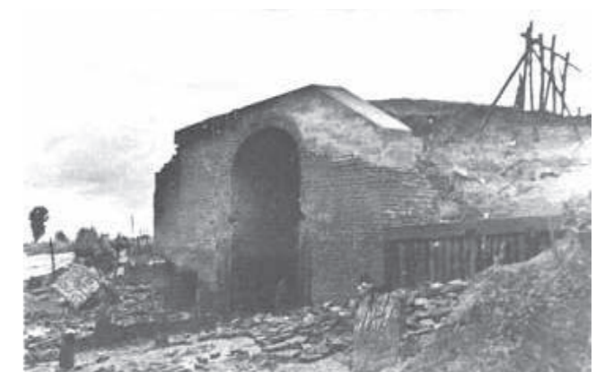
Voormolen (65). molendatabase.nl