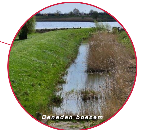
Locatie De Heul, Google Earth 2026 Onderdelen zijn tevens benoemd op de water erfgoedkaart van HDSR