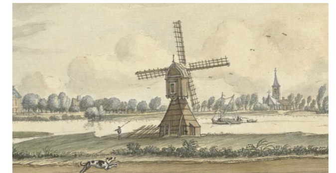
Wipmolen op de zomerdijk, omstreeks 1781 vervangen door achtkantige molen