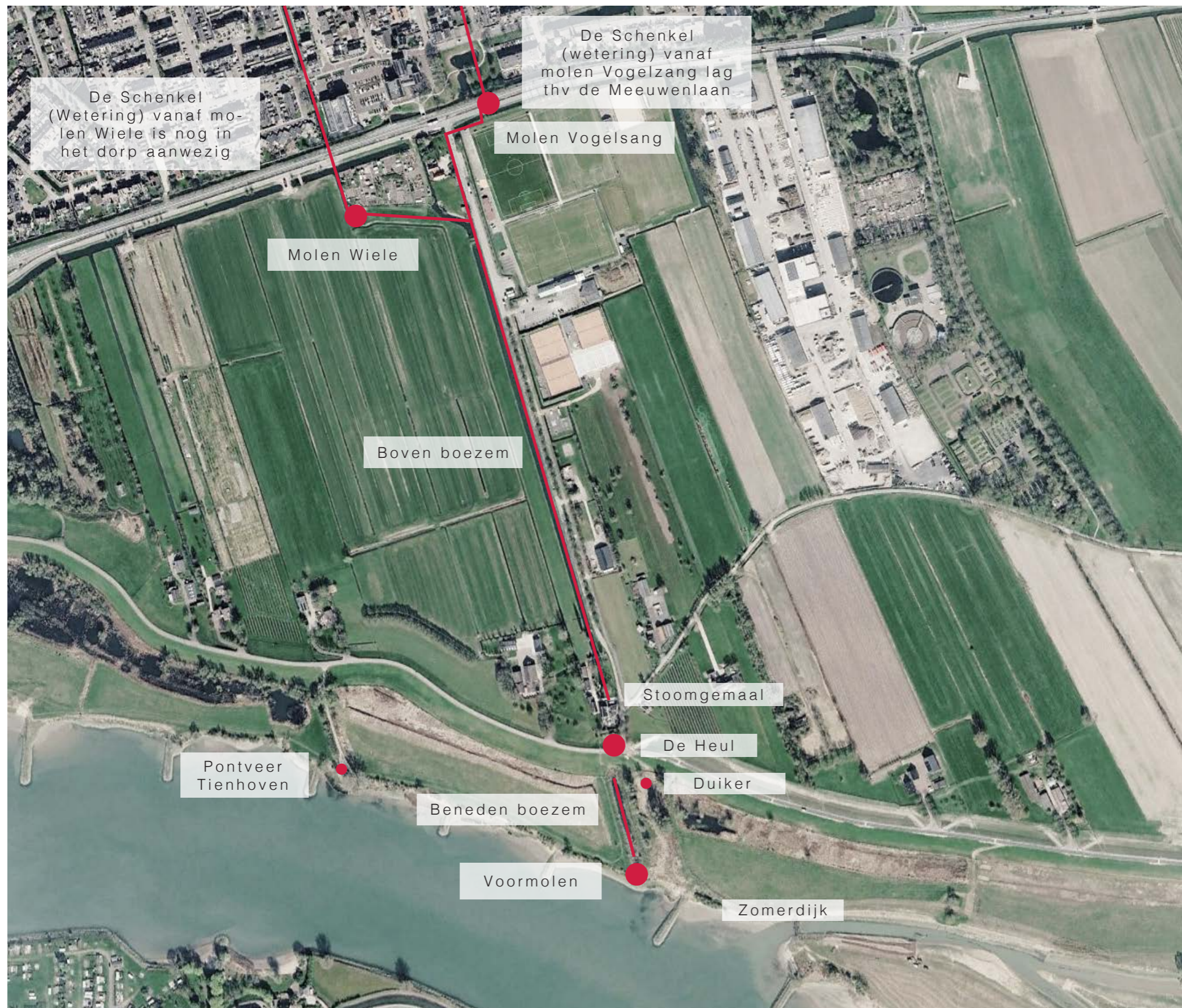
Zuidzijde Lopik, Google Earth, 2026

De locaties van de molens en de dijkdoorlaat zijn in het huidige landschap nog herkenbaar, evenals de oude waterlopen. De molens zijn verdwenen en de restanten van de Voormolen zijn recent door Rijkswaterstaat verwijderd.