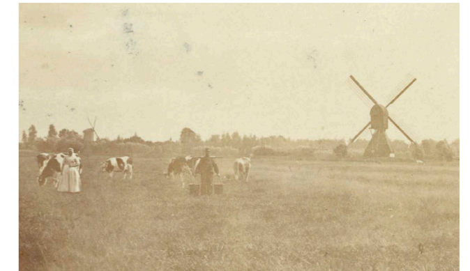
Molen Wiele en in de verte (links) Vogelzang (62)

De locaties van de molens en de dijkdoorlaat zijn in het huidige landschap nog herkenbaar, evenals de oude waterlopen. De molens zijn verdwenen en de restanten van de Voormolen zijn recent door Rijkswaterstaat verwijderd.